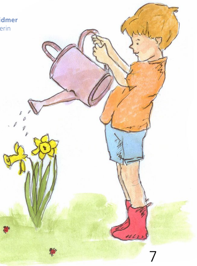
Denise Widmer Gesamtleiterin

Eine ISO Zertifizierung beschreibt den Prozess, in dem unsere Institution einen Konformitätsnachweis erlangt, der bestätigt, dass die internationale Norm für Qualitätsstandards eingehalten wird. Zudem beschreibt eine erfolgreiche Zertifizierung, dass unser Qualitätshandbuch mit sämtlichen Abläufen stringent ist und in der Praxis gelebt wird. Wir sind stolz auf unsere Zertifizierung, zeigt sie doch auch gegen aussen, wie professionell wir arbeiten.